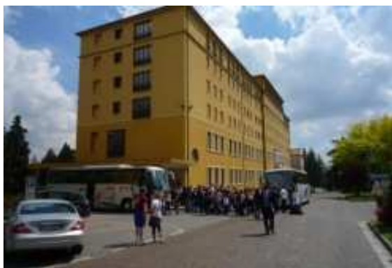
L' Istituto Filippin di Paderno del Grappa con la nuova targa della Sede