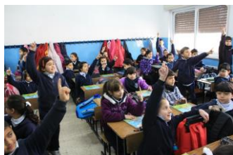
Bonjour de Ramallah (Palestine)