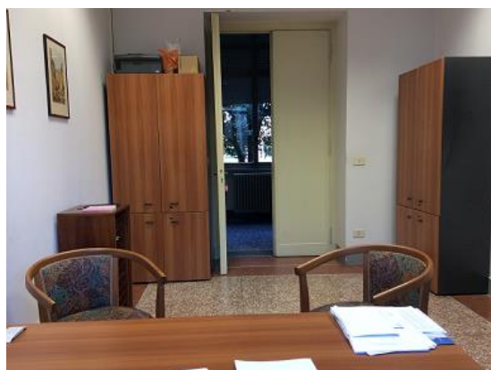
Sede de Roma/ Siège Rome / Rome Headquarters

En Madrid también hemos podido conseguir abrir una oficina en un céntrico edificio que reúne en su interior a varias empresas de diversa índole católica.