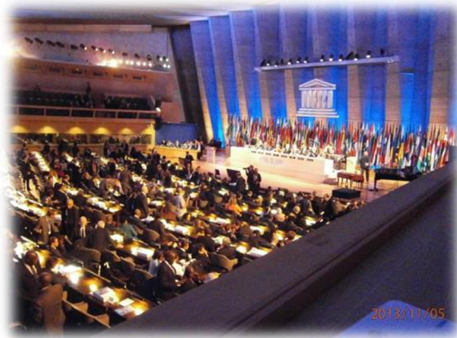
Vista General/ vue d'ensemble/Overview