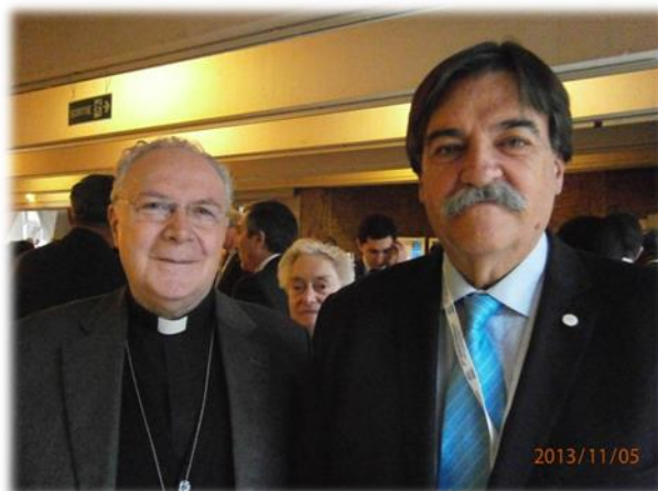
Mons. Follo, representante del Vaticano/ Mgr. Follo, représentant du Vatican / Monsignor Follo, Vatican representative.